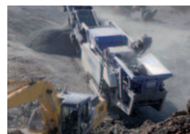
Die Recyclinganlage zerkleinert mittelharten Naturstein, Bauschutt, Asphalt und Kies.