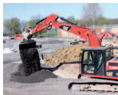
Baggereinsatz im Bereich der neuen Abscheideranlagen im Rahmen der von der Gustav Marsch GmbH & Co. KG durchzuführenden Umbaumaßnahmen.

Der Auftrag im Rahmen des Umbaus der Niederlassung umfasst die Herstellung der Außenanlagen und den Abbruch des Bürogebäudes, der Werkstatt- und Waschhalle sowie des Schwerteilelagers in mehreren Bauabschnitten. Neben den Gebäuden, die in den 60er-Jahren entstanden und nicht mehr dem Stand der Technik entsprechen, sollen auch die