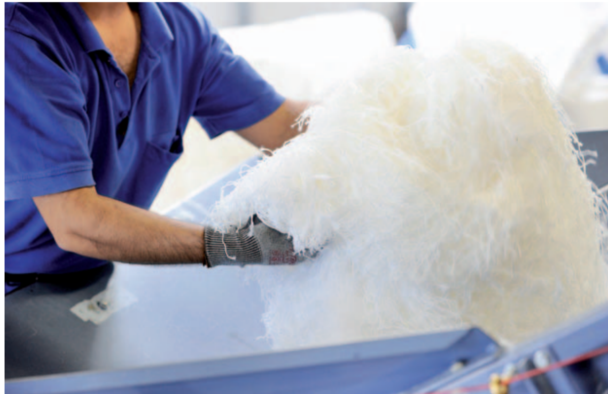
Polyamidfasern werden im Zuge der Agglomeration auf das Förderband in der Mühle aufgegeben.

Stricker PolyRec GmbH & Co. KG betreibt Agglomerationsanlage zur Aufbereitung von Produktionsrückständen