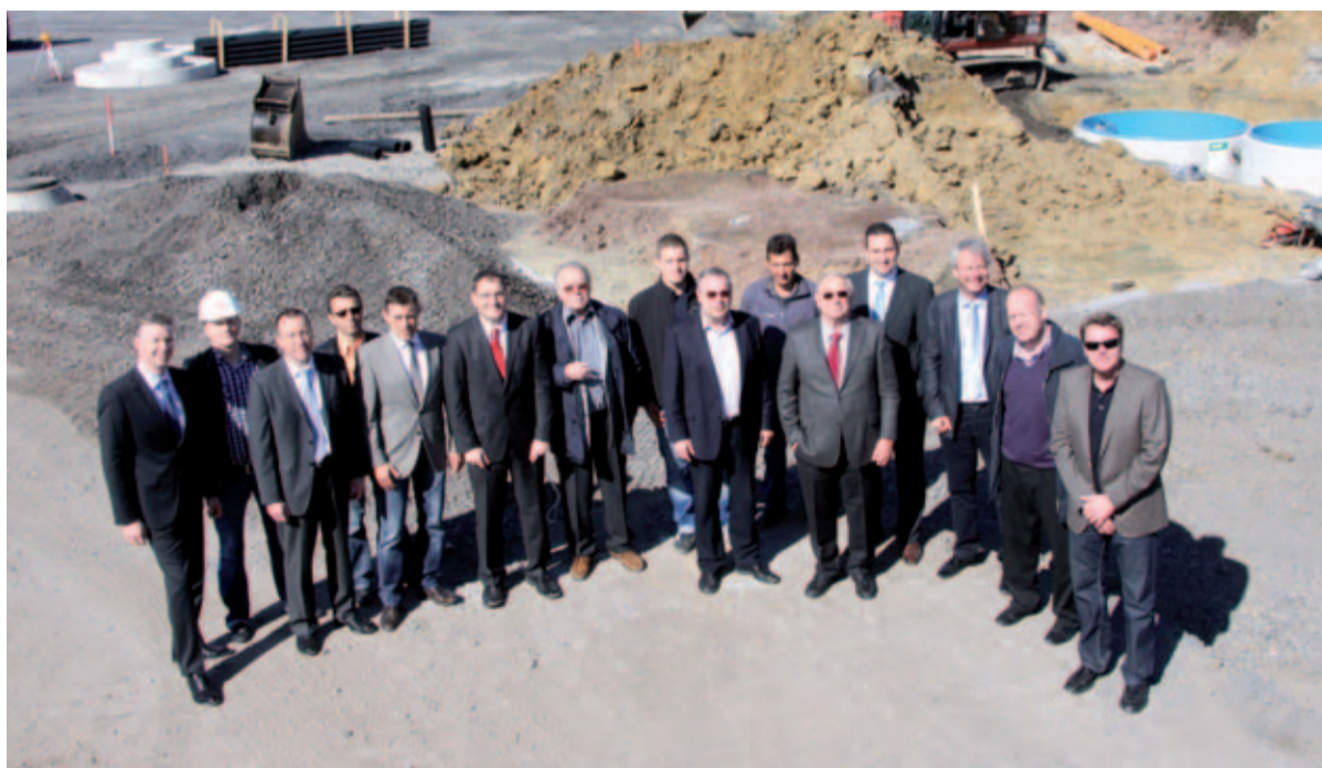
Beim offiziellen ersten Spatenstich am 8. April trafen sich die Vertreter der Firmen Zeppelin, Gustav Marsch, Stricker und Köster auf dem Gelände der Zeppelin Niederlassung in Hamm.

Pflasteroberflächen der Niederlassung erneuert werden. Diese haben unter dem fortwährenden Verkehr von Kettenfahrzeugen äußerst stark gelitten und werden deshalb gegen einen halbstarren Belag (Densiphalt) ausgetauscht.