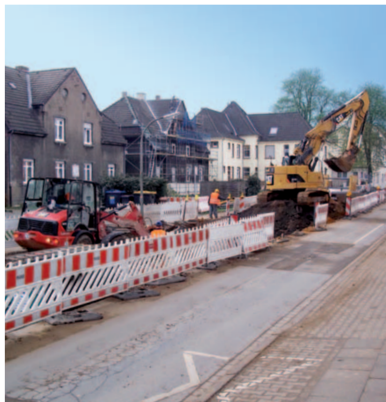
Der Bauabschnitt auf der Strecke zwischen Bermesdicker Straße und „Im Odemsloh“ erstreckt sich über eine Länge von ca. 700 Meter.

In Dortmund-Bodelschwingh, nahe der ehemaligen Zeche Westhausen und dem Malakow-Turm, liegt die Bodelschwinger Straße. Im Rahmen einer beschränkten Ausschreibung vergab das Tiefbauamt der Stadt Dortmund zu Beginn des Jahres den Auftrag zum Ausbau der Bodelschwinger Straße, der die Bereiche Kanal- und Straßenbau beinhaltet. Mit der Ausführung wurde schließlich die Gustav Marsch GmbH & Co. beauftragt.