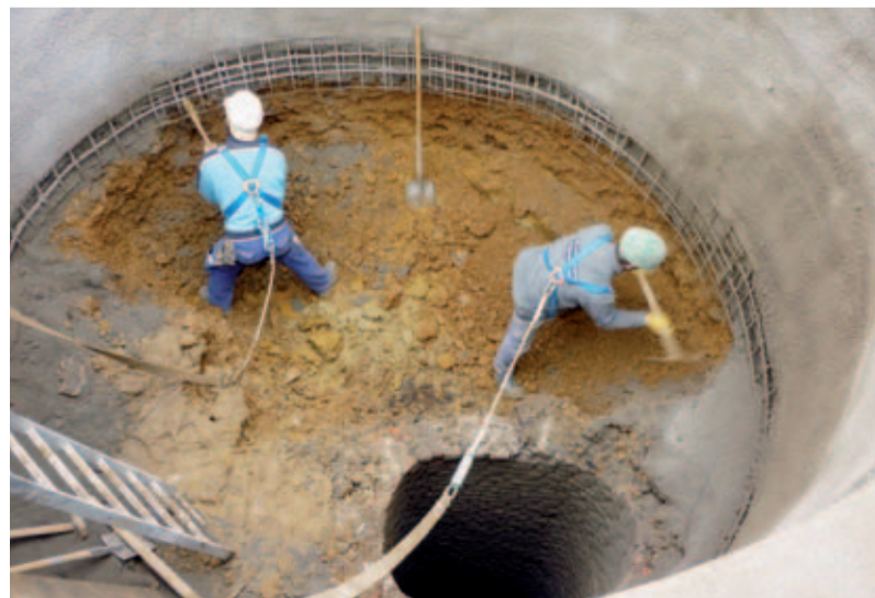
Der ehemalige Lichtschacht auf Privatgrund auf den Hoheneich Stollen konnte im Frühjahr gesichert werden.