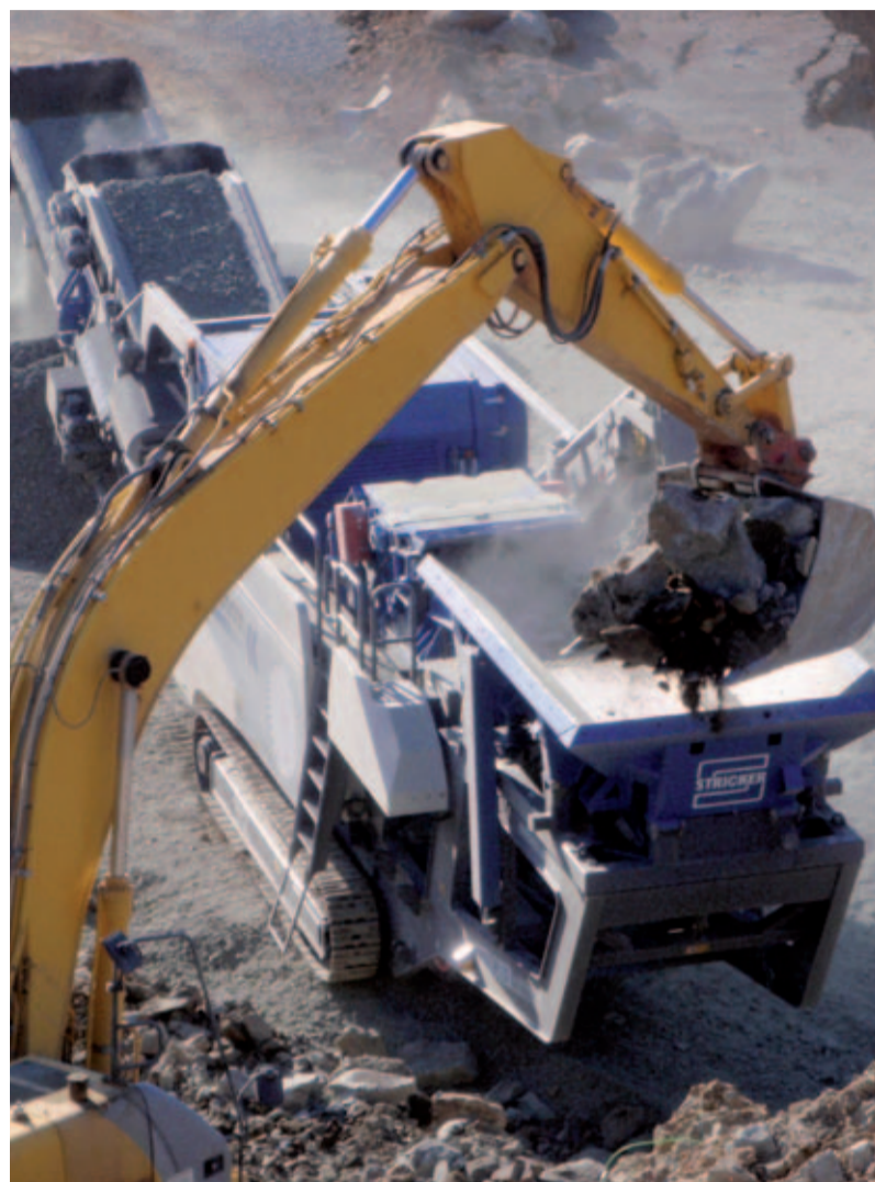
Die neue MOBIREX MR 130 Z EVO Recyclinganlage aus dem Hause Kleemann.

Zu den Kernkompetenzen der Stricker GmbH & Co. KG zählt neben der Umwelttechnik und dem Straßenbaustoffhandel die Natur- und Bauschutttaufbereitung. In diesem Bereich zählt das Unternehmen zu den führenden Anbietern von Lösungen in der