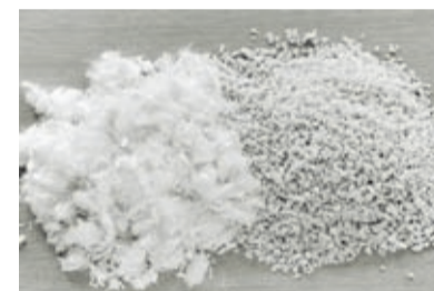
Fasern und Granulat im Vergleich