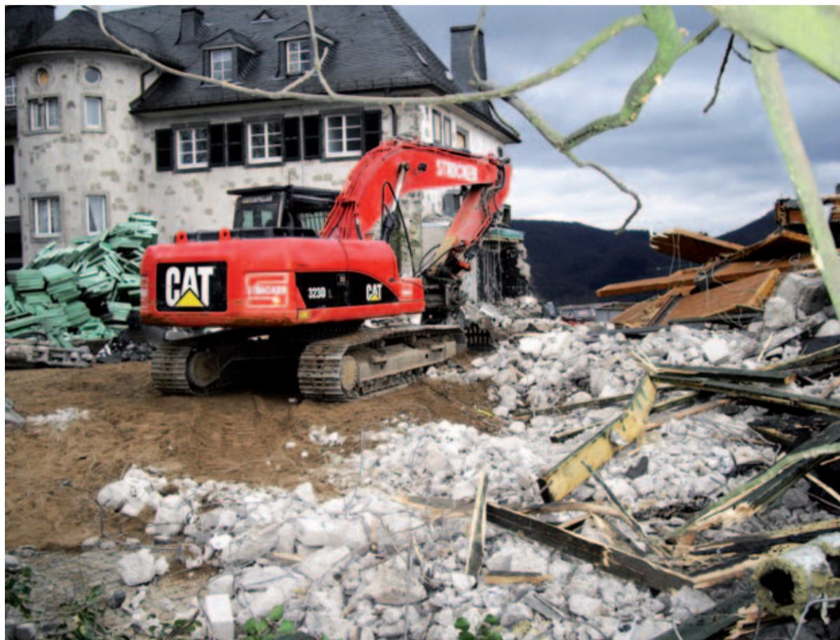
Das Projekt „Drachenfels“ zählt zu den interessantesten und außergewöhnlichsten Aufträgen der Firma Stricker GmbH & Co. KG. Die Abbrucharbeiten begannen im November 2010 und sollten innerhalb kürzester Zeit abgeschlossen sein.

Die Stricker GmbH & Co. KG aus Dortmund erhielt in beschränkter Ausschreibung im November 2010 von der Wirtschaftsförderungs- und Wohnungsbaugesellschaft mbH der Stadt Königswinter den Auftrag, unter der strengen Aufsicht einer eigens beigestellten ökologischen Bauleitung, diese Herausforderung umzusetzen. Aufgrund einer tonnagesbeschränkten historischen Brücke (24t) waren die An- und