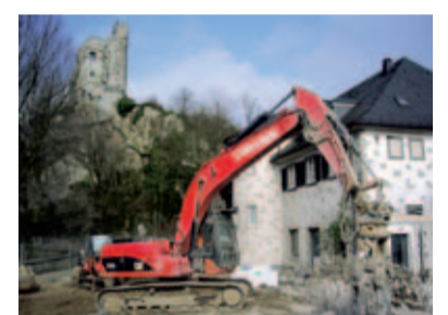
Während des Rückbaus musste auf engstem Raum gearbeitet werden. Zusätzlich behinderte der frühe Wintereinbruch die Bauarbeiten.

spannende Maßnahme erfolgreich und vor allem termingerecht abgeschlossen werden. Auch die Mauereidechse kann nun ihr geschütztes Refugium wieder ungestört nutzen. Nicht nur der sensationelle Blick auf das Rheintal unterhalb der Burgruine, sondern auch der seltene Ausblick auf eine Abbruchbaustelle mitten in einem der restriktivsten Naturschutzgebiete Deutschlands war baubegleitend der Anziehungspunkt auf dem Drachenfelsplateau. Allein im Januar 2011 kamen bereits 4.000 Besucher und bestaunten die neue Aussicht.