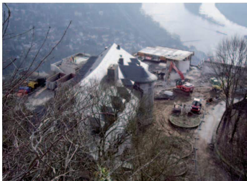
Während der Baumaßnahme hatte das Stricker Team einen sensationellen Blick auf das Rheintal.

Dieses Projekt war für die Stricker GmbH zwar kein Großprojekt, doch die logistische und technische Herausforderung war außergewöhnlich und in der Branche nicht alltäglich. Im März 2011 konnte diese